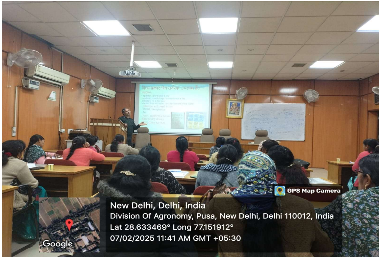
New Delhi, Delhi, India Division Of Agronomy, Pusa, New Delhi, Delhi 110012, India Lat 28.633469° Long 77.151912° 07/02/2025 11:41 AM GMT +05:30