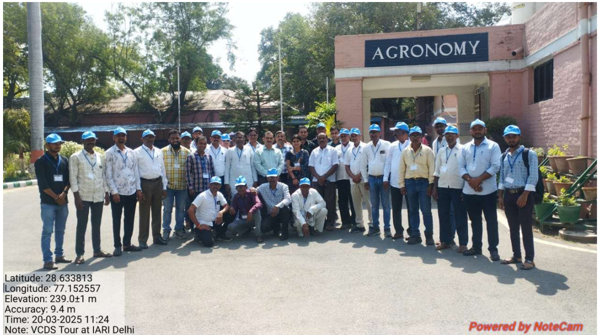
Latitude: 28.633813 Longitude: 77.152557 Elevation: 239.0±1 m Accuracy: 9.4 m Time: 20-03-2025 11:24 Note: VCDS Tour at IARI Delhi