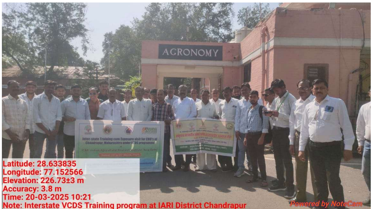
Latitude: 28.633835 Longitude: 77.152566 Elevation: 226.73±3 m Accuracy: 3.8 m Time: 20-03-2025 10:21 Note: Interstate VCDS Training program at IARI District Chandrapur